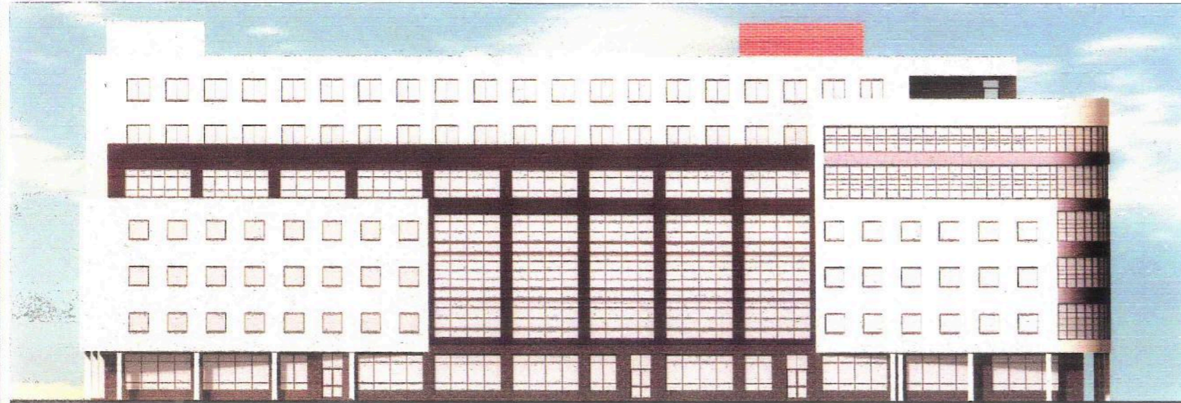
Фасад в осях 15-1.