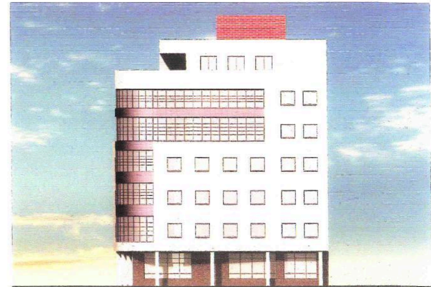
Фасад в осях E-A.